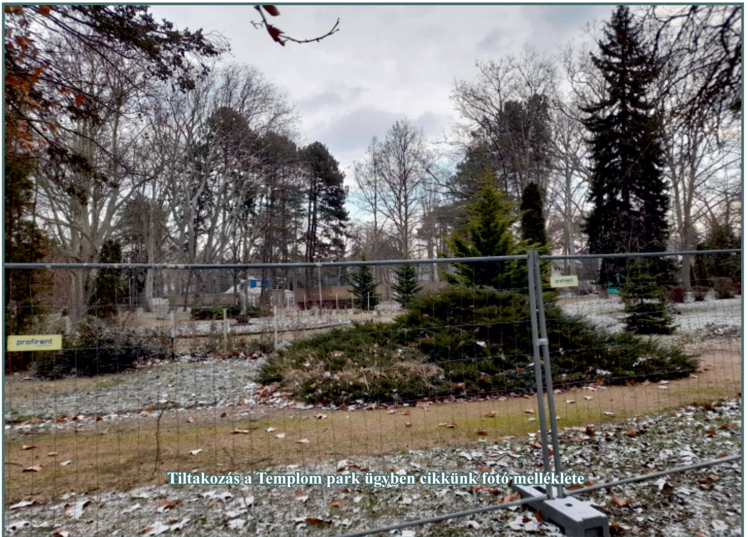
Tiltakozás a Templom park ügyben cikkünk fotó melléklete