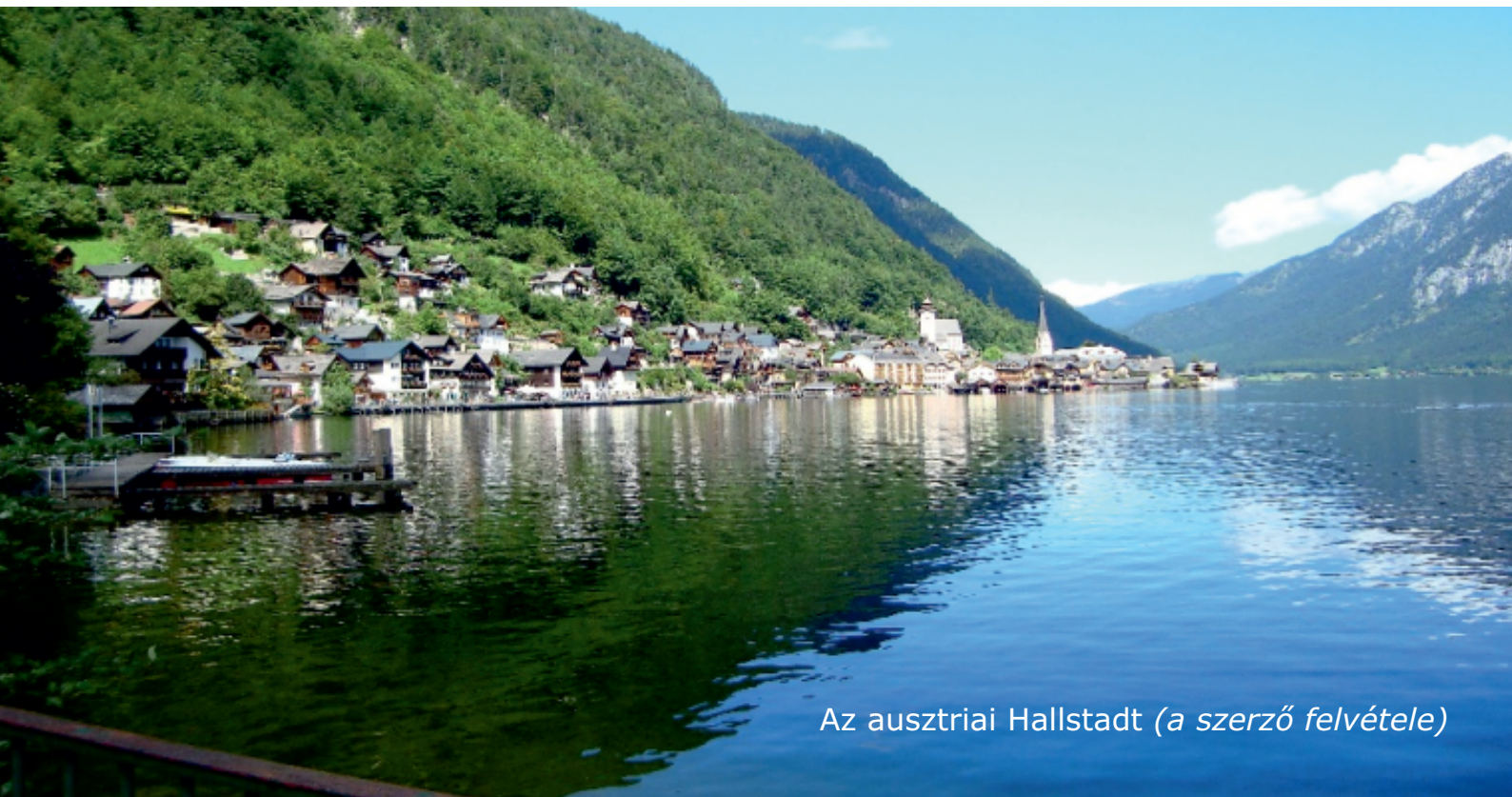
Az ausztriai Hallstadt