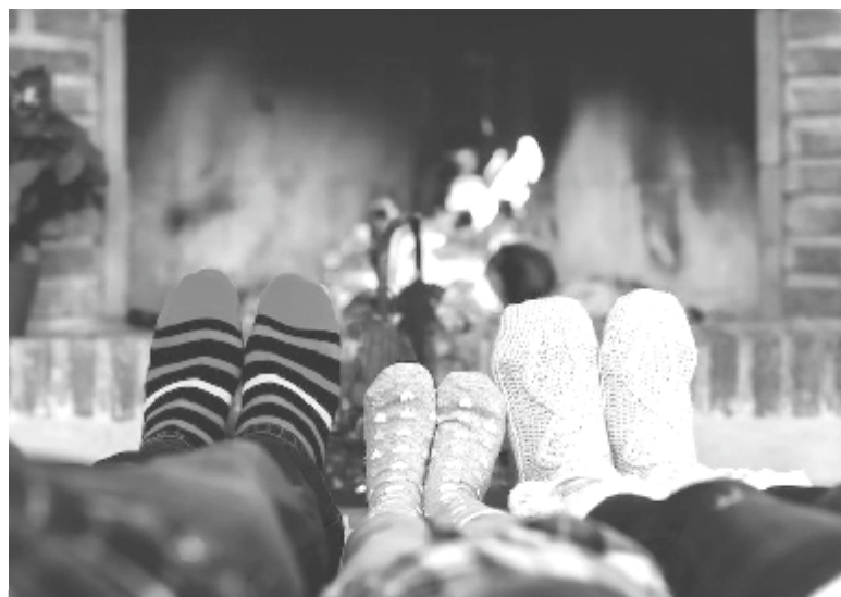
A hygge életérzés (a kép illusztráció)

Persze a hygge érzés más módon is létrehozható. Dániai tartózkodásom során magam is tapasztaltam, hogy nyaranta, a Vedbaek-i kikötőben álló vitorlások baráti összejövetelek színterei voltak. Éjszakába nyúló, jó hangulatú találkozónak, borozgatásoknak adtak otthont anélkül, hogy a hajóval elhagyták volna a kikötőt.