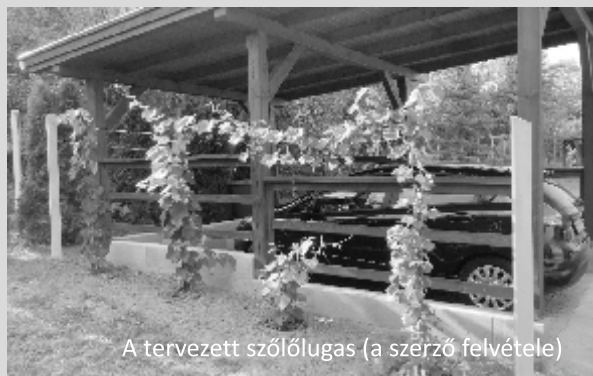
A tervezett szőlőlugas

Egykoron, fiatal éveimben, az iskola melletti, az idő által kikezdet (ma már nem létező) ház falát „támasztotta” az, a vesszőit rakoncátlanul nevelő, nehezen kordában tartható szőlőlugas, amely kellemes árnyat adott az alatta ülőknek, szeptember-október hónapban pedig, minden évben, bőséges terméssel jutalmazott meg bennünket. Olyannyira, hogy jutott belőle még a kamrába is. A madzagra gondosan felkötözött szebb fürtök, már-már mazsolává aszalódva várták, hogy a karácsonyi asztal csemegéi lehessenek. Az akkoriban még elterjedt, ma már kevésbé népszerű, bor készítésére alkalmatlan (un. direkt termő) Izabella szőlő, kissé vastagabb, kék héjával, fehér, kellemesen illatos, lédús húzával kedvememnek számított. Az utóbbi években egyre inkább vágytam arra (lehet, hogy az időskori nosztalgia okán is), hogy újra megízlelhessem ezt a szőlőfajtát. A világhálón történt hosszas kutakodás után megtaláltam, hol juthatok hozzá ilyen szőlőoltványhoz. Végül sikerült olyan egyedet találnom, ami az eredeti szőlőfajta, Izotella nevet viselő, nemesített változata. Korábbi érési idejével (augusztus közepe-vege), nagyobb bogyójú, hengeres, vagy kúpos, hosszan tőkén tartható fürtjeivel vonzó ajánlatnak tűnt.