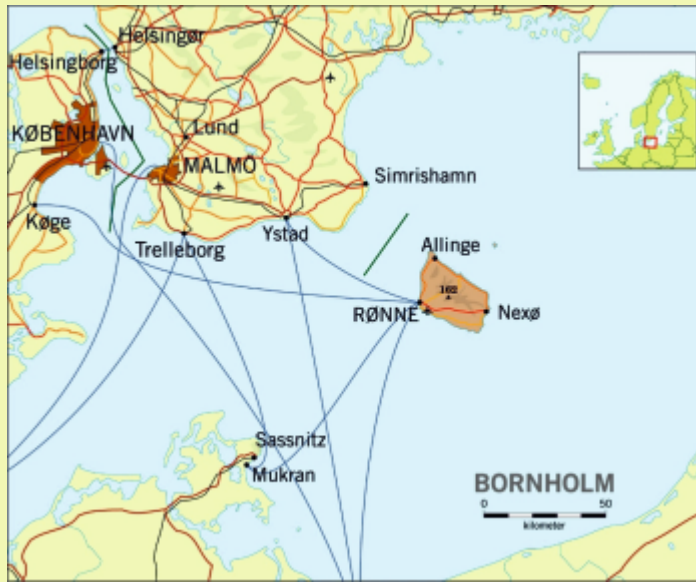
Bornholm elhelyezkedése a térképen