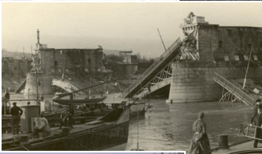
Horthy Miklós kora