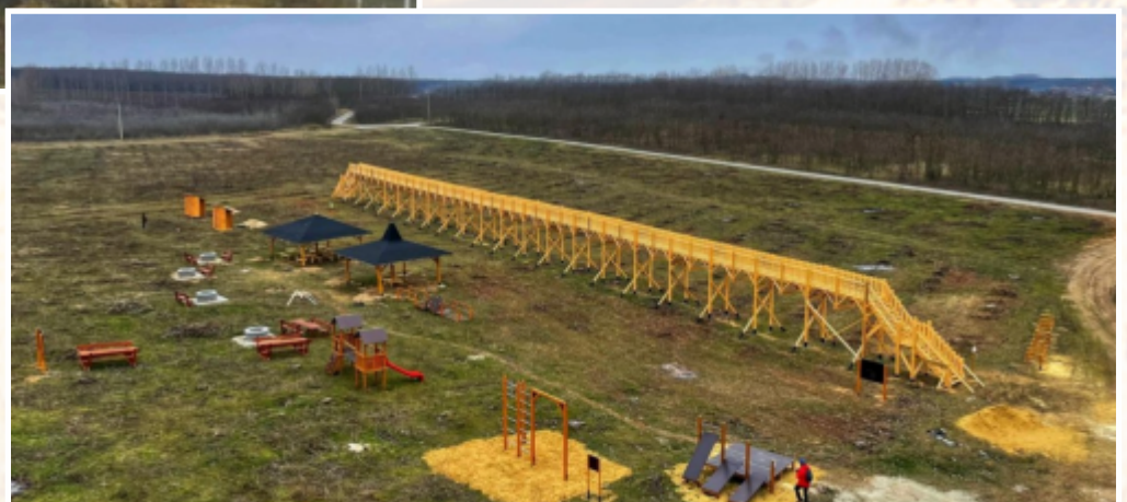
Orbán Viktor kora