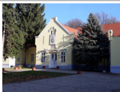
A toponári Általános Iskola épületének homlokzata ma

Fekete István: Ballagó idő (Életrajzi regény), Móra Ferenc Könyvkiadó, Budapest, 1970.