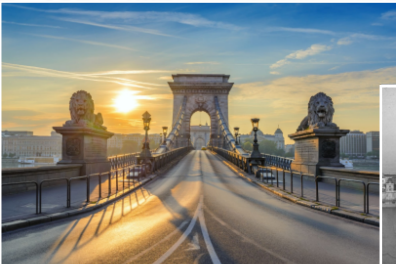
Széchenyi István kora