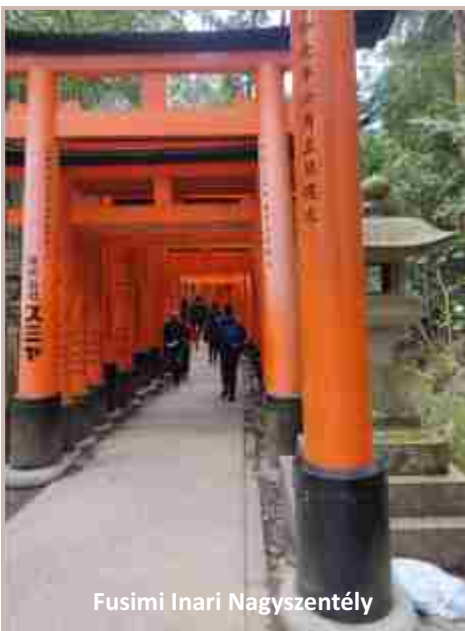
Fusimi Inari Nagyszentély