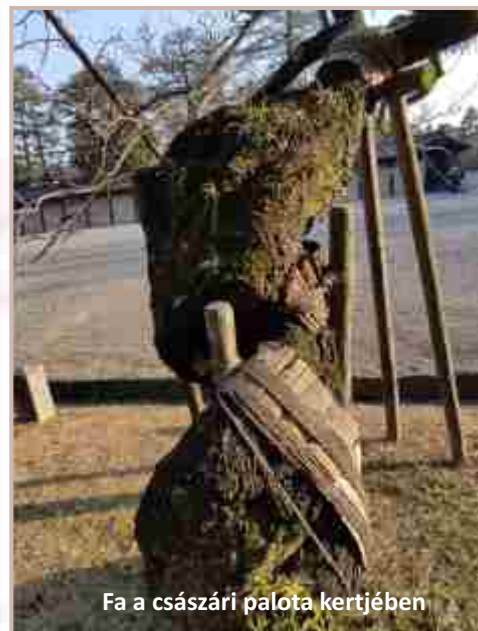
Fa a császári palota kertjében