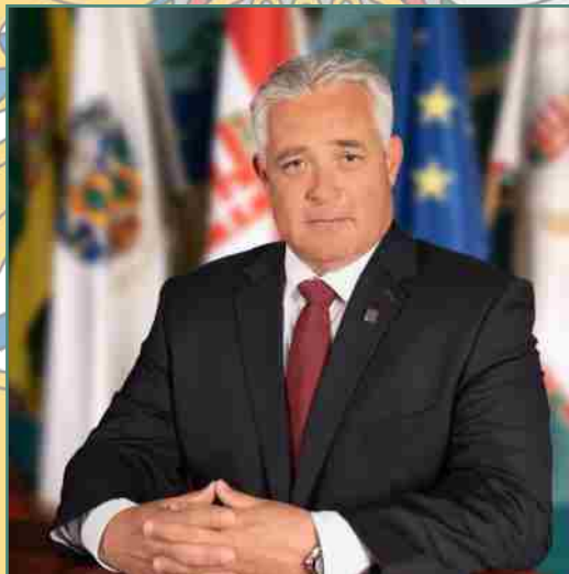
Holoivits Huba polgármester Fidesz