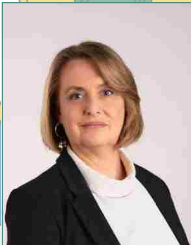
Kovács Emőke képviselő Fidesz